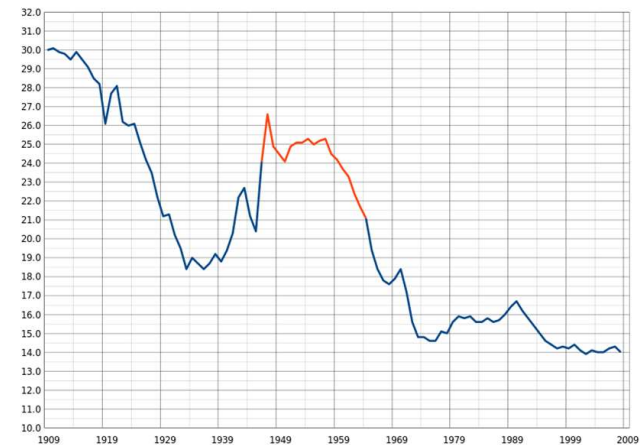
Γράφημα: United States birth rate (births per 1000 population). The red segment from 1946 to 1964 is the postwar baby boom, with birth rates starting to drop around 1960.